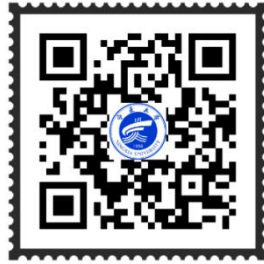
宁夏大学统一支付平台